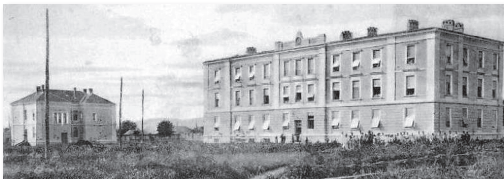
Slika 4. Novosazidana Okružna bolnica u Nišu, svečano je puštena u rad 1. marta 1910. godine