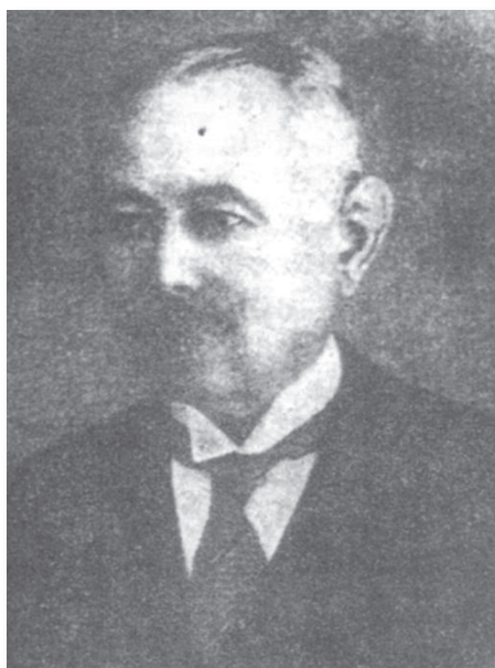
Slika 1. Dr Dragoljub Đorđević (29. decembar 1866, Beograd, Kneževina Srbija – 20. januar 1942. g. Beograd, Kraljevina Jugoslavija), začetnik oftalmologije u Nišu, osnivač i prvi šef Očnog odeljenja Okružne bolnice u Nišu, šef Drugog očnog odeljenja Opšte državne bolnice u Beogradu, patriota, učesnik balkanskih ratova i Prvog svetskog rata

Dr Dragoljub Đorđević prvi posao dobija u Nišu, kada je ukazom od 4. avgusta 1894. postavljen za fizikusa sreza nišavskog, okruga pirotskog. Posle nepuna tri meseca lekarske prakse, dr Dragoljub Đorđević ukazom od 31. oktobra 1894. biva postavljen za fizikusa sreza beličkog, okruga moravskog. Zatim, dr Dragoljub Đorđević biva ukazom od 22. februara 1899. godine imenovan za fizikusa sre-